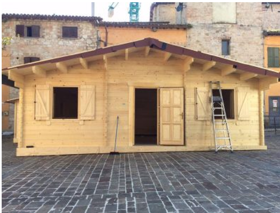
La casa prefabbricata donata al Comune di Muccia dalle due associazioni di volontariato

Il terremoto che quasi un anno fa ha devastato le città dell'Alto Maceratese e dell'Ascolano, ha dato il via a molti gesti di solidarietà. Tra questi anche l'iniziativa che porta la firma di due associazioni di volontariato di Protezione civile, attive tra Marche e Romagna, la Vab (Vigilanza Antincendi Boschivi) di Ravenna e 'Le Aquile Unità Cinofile da Soccorso' sezioni di Ravenna, Forlì, Cesena, Rimini e di quella costituenda ad Ancona. Sabato prossimo, 8 luglio, una nutrita delegazione di volontari sarà a Muccia per far festa ed inaugurare la casetta prefabbricata, già consegnata alla popolazione, donata grazie a una raccolta fondi e alla vendita di un calendario artistico. I 150 attivisti delle due onlus, tra i primi a raggiungere Amatrice, Arquata del Tronto e poi Muccia, all'alba di quel maledetto 24 agosto 2016 sono rimasti segnati dalla immagini di distruzione introiettate nei 45 giorni di lavoro con le unità cinofile tra le macerie dei Comuni, nel cratere del sisma. Una volta rientrati nel loro quotidiano si sono prodigati per portare a termine la loro idea, ribattezzata progetto 'Sabini', dal nome dell'antica Sabina, l'area geografica che va dall'Alto Tevere all'Appennino marchigiano un tempo abitata dal popolo dei Sabini.